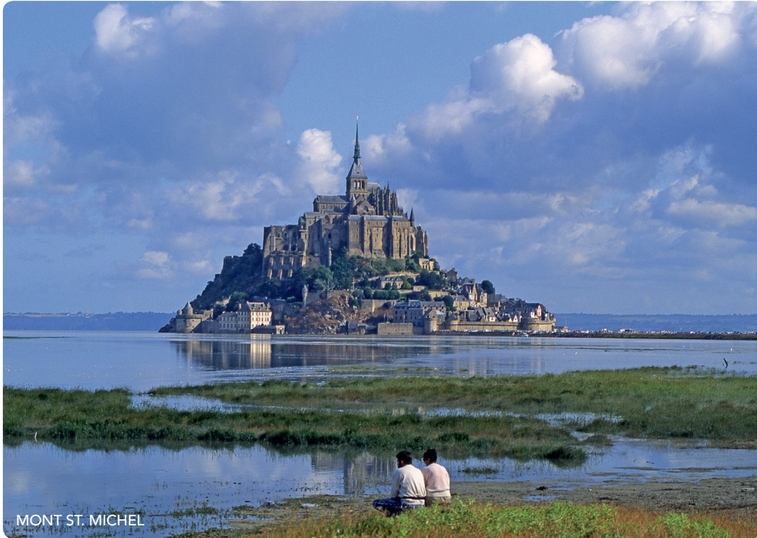
MONT ST. MICHEL